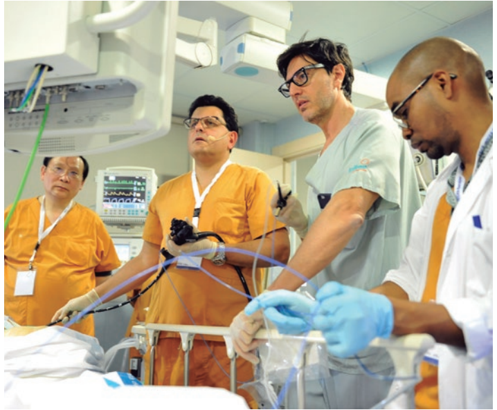
Imágenes de los quirófanos del Servicio de Endoscopia Digestiva del Hospital Universitario Vall d'Hebron y del Simposio Cena de Bienvenida.