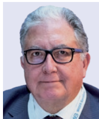
A. J. Torres García